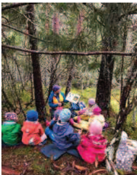
Rycina 11. Przedszkolaki na spacerze w lesie