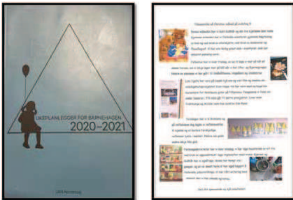
Rycina 18. Dziennik zajęć – fragment miesięcznego podsumowania