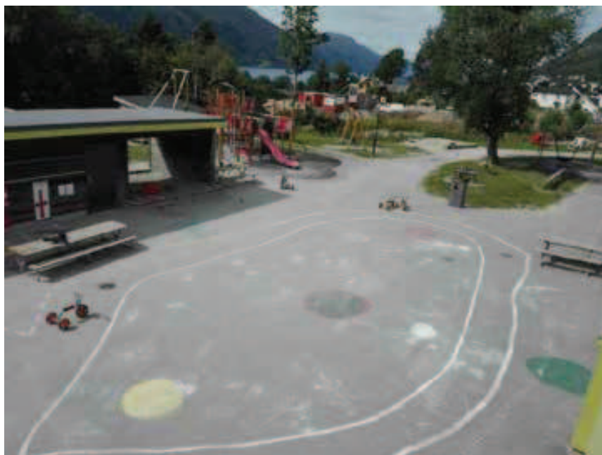
Rycina 9. Plac zabaw na terenie przedszkola