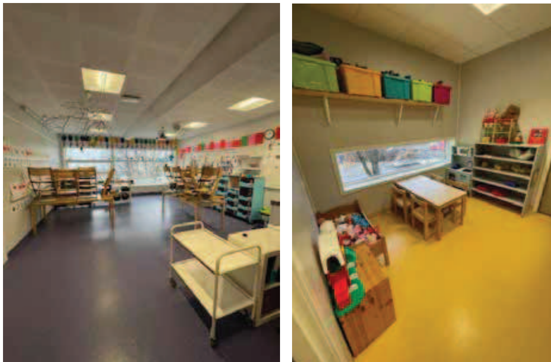
Rycina 5. Pomieszczenie grupy: starszej (po lewej stronie) i młodszej (po prawej)