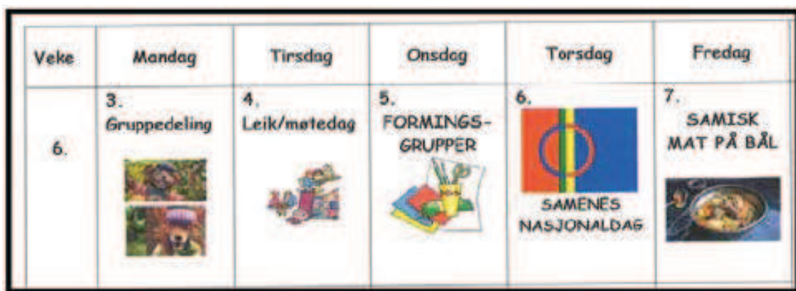
Rycina 16. Tygodniowy plan zajęć grupy 3-6 lat