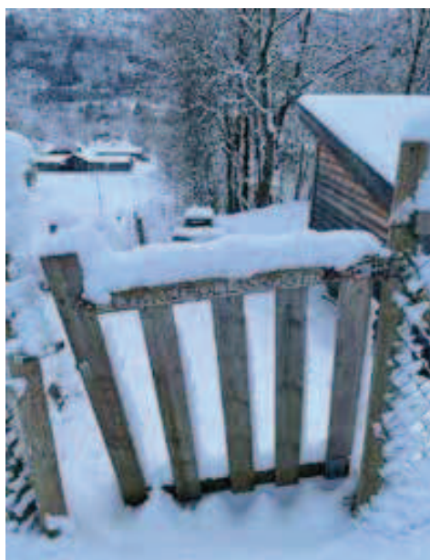
Rycina 12. Lasek szczęśliwego trolla – lykketroll skogen