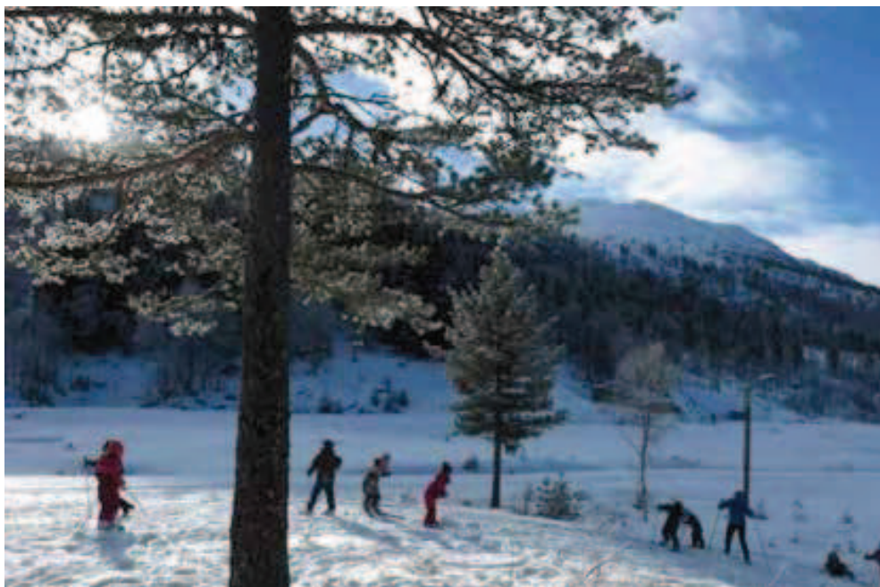
Rycina 10. Jazda przedszkolaków na nartach