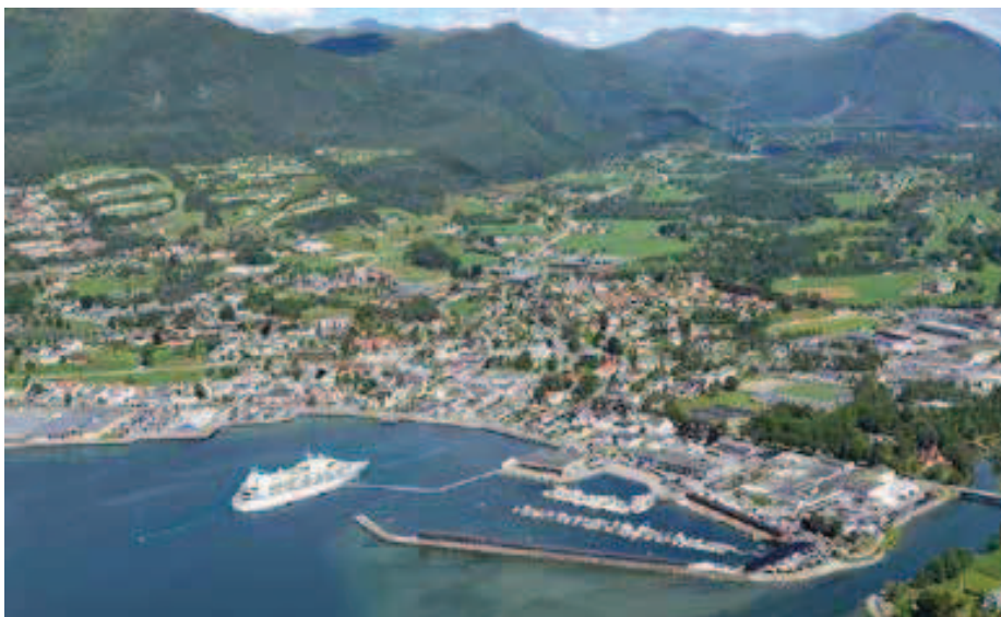
Rycina 1. Nordfjordeid