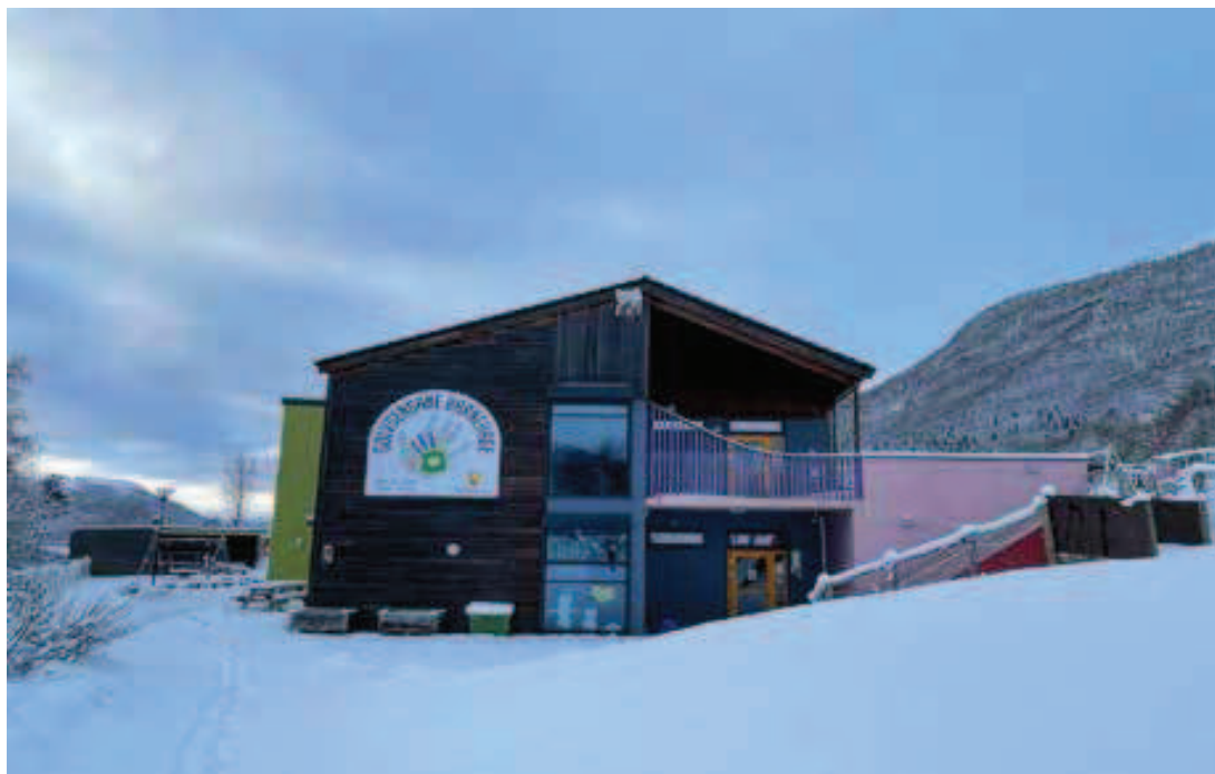
Rycina 4. Drewniana część przedszkola z jego sztyldem