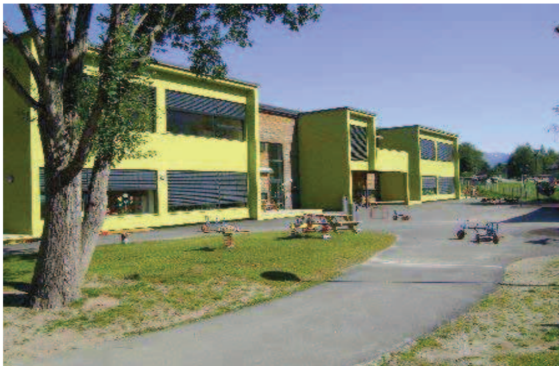
Rycina 3. Przedszkole Golvsengane w Nordfjordeid