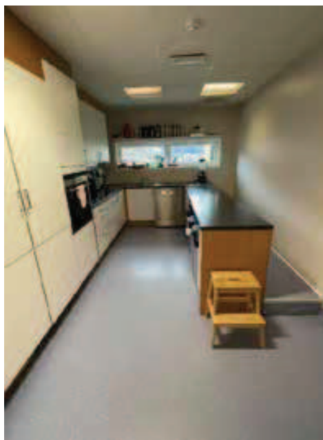
Rycina 6. Jedna z kuchni Rycina 7. Pokój wypoczynkowy kadry pedagogicznej