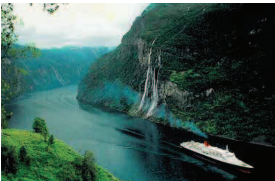
Rycina 2. Wodospad Siedmiu Sióstr (De syv søstre)